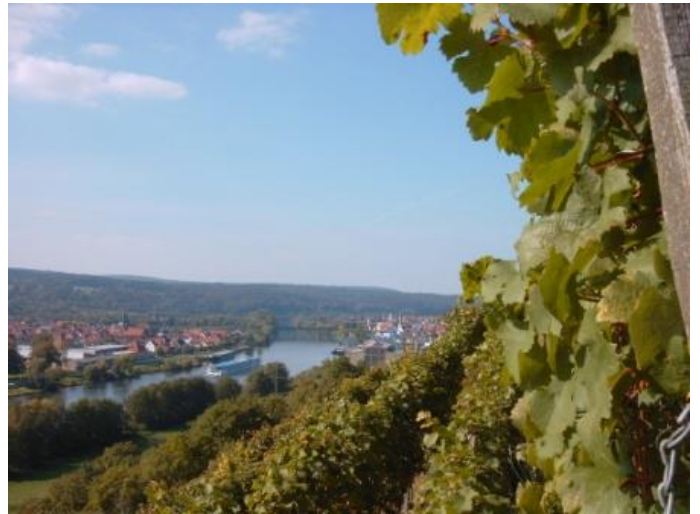
Blick in die Weinberge