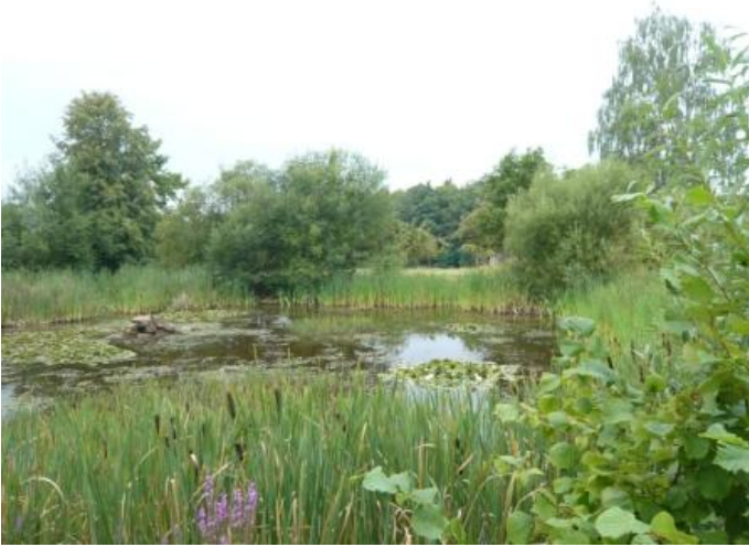
Biotop Sohl im Stadtteil Mechenhard