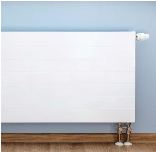
Flächenheizungen sind optimal, aber kein Muss. Wärmepumpen lassen sich auch mit herkömmlichen Heizkörpern wirtschaftlich betreiben.

Wenn die Heizfläche ausreicht, um die Räume mit einer Vorlauftemperatur von maximal 55 Grad Celsius auf die gewünschte Temperatur zu bringen, arbeiten Wärmepumpen auch mit konventionellen Heizkörpern einwandfrei und wirtschaftlich. Richtig ist: Mit Flächenheizungen sind Wärmepumpen besonders effizient. Doch wie beim ersten Punkt trifft dies natürlich auch auf alle anderen Systeme ebenfalls zu.