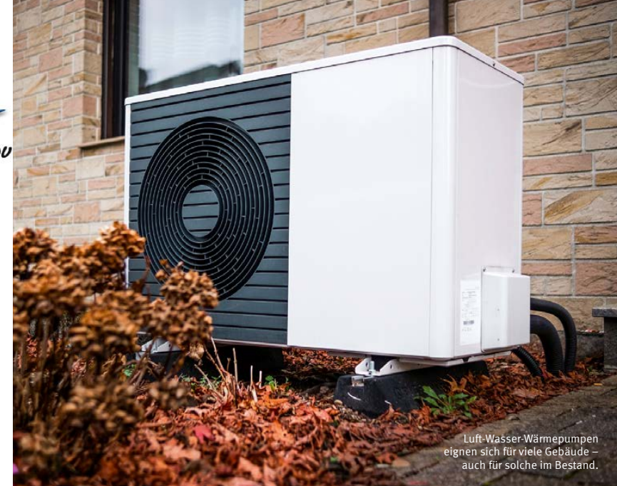
Luft-Wasser-Wärmepumpen eignen sich für viele Gebäude – auch für solche im Bestand.