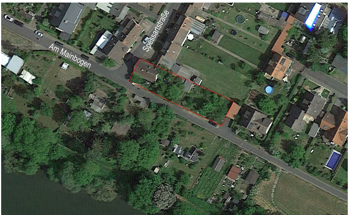
Lage des Plangebietes im Luftbild

Es sollen 2 Gebäude mit jeweils maximal 2 Wohneinheiten in zwei differenzierten Baufeldern entstehen.